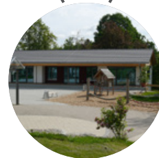
Haus der Begegnung → 2016