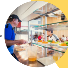
Start Mensabetrieb → 2006