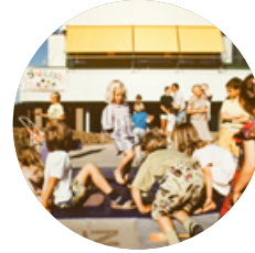
Erweiterung Grundschule → 1990