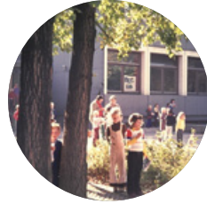
FES im Bea-Haus → 1974