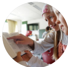
Neues Leitbild → 2016