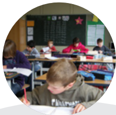
Gründung Realschule → 2009