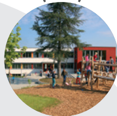
Schulgebäude in Lais → 2013