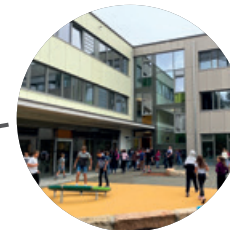
Realschule Dußlingen → 2019