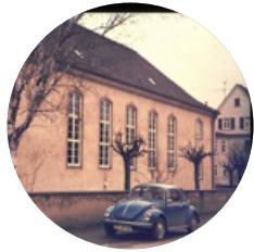
Schulstart im Gemeindehaus Betzingen → 1973